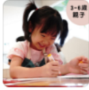
疫情新上線 | 創... NT$360

Mood Card 慕... NT$300 我好你好 | 好心... NT$500 囡仔 | 環保紗餐... NT$350