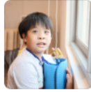
兒盟學苑 | (免... NT$500