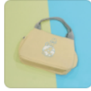
囡仔 | 環保紗便... NT$590