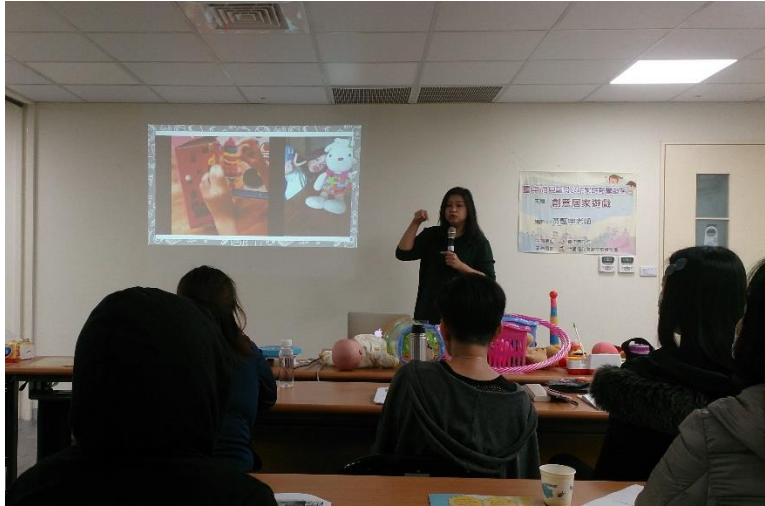
短期托育家庭保母訓練