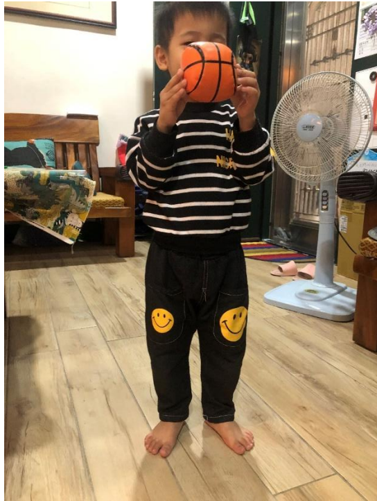
社工去保母家訪視出養童