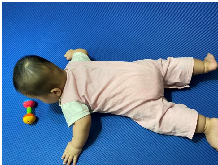
社工去保母家訪視出養童